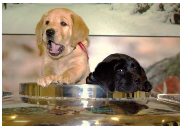
液体窒素から蘇った2頭のラブラドル